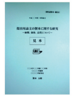
簡易製本 (ソフトカバー)