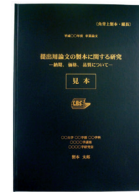
上製本 (ハードカバー)