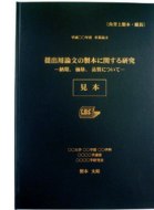
上製本 (ハードカバー)